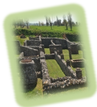
Parco Archeologico Aeclanum