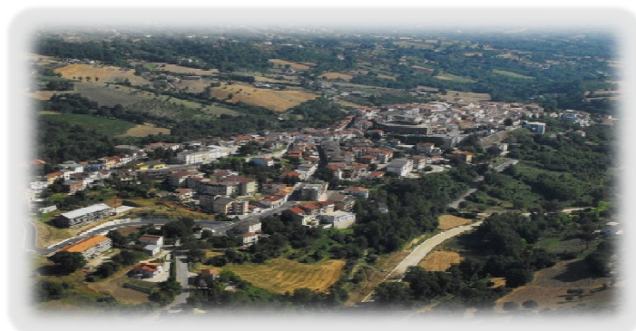
CITTÀ DI MIRABELLA ECLANO