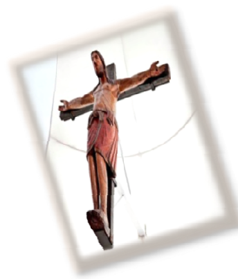
Cattedrale Santa Maria Maggiore Crocifisso Normanno (Sec. XII)