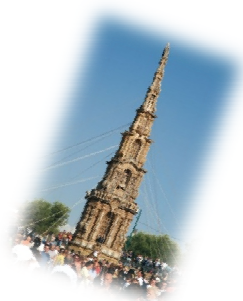
Obelisco di paglia