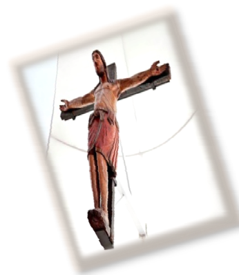
Cattedrale Santa Maria Maggiore Crocifisso Normanno (Sec. XII)