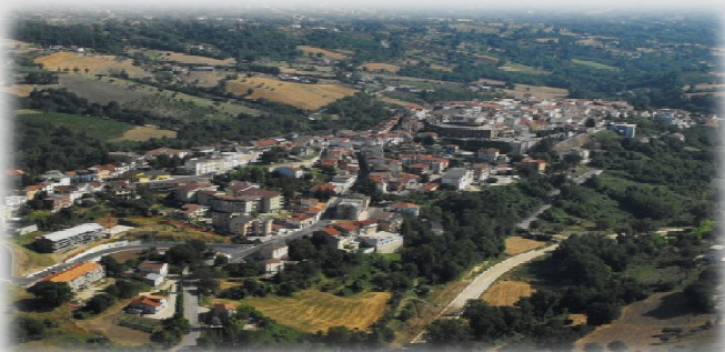
CITTÀ DI MIRABELLA ECLANO