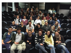
Festival 2015: la Giuria di Ragazzi

Il Festival delle Scuole è un Concorso di Teatro a cui sono ammessi, previa compilazione della domanda allegata, gruppi di teatro delle Scuole Secondarie di 2° grado . Il Concorso si svolge durante il mese di maggio e la Cerimonia di Premiazione dei vincitori si tiene domenica 29 maggio 2016 all'ITC Teatro di San Lazzaro. L'iscrizione è gratuita . Per partecipare è sufficiente, dopo aver letto il bando di concorso, compilare e firmare il modulo di iscrizione e la scheda di partecipazione allegati e inviarli con le modalità e nei tempi indicati. I gruppi partecipanti si esibiscono davanti a una giuria composta interamente da ragazzi , provenienti da tutte le scuole in concorso, che dovranno valutare testo e recitazione, grado di difficoltà e originalità, costumi, scene e musiche degli spettacoli in gara. La giuria è senz'altro una delle cose più belle nonché il simbolo di questa rassegna dedicata ai più giovani. Al termine della manifestazione, la scuola prima classificata riceverà un premio in denaro pari a euro 1.500 , che la scuola si impegna a spendere nell'organizzazione di attività culturali destinate agli allievi, nonché il diritto a partecipare all'edizione 2017 della Manifestazione Teatro Lab organizzata dal Centro Teatrale Europeo Etoile sul territorio della Provincia di Reggio Emilia.