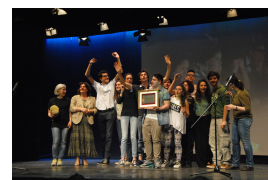
I vincitori dell'edizione 2015: Istituto "Giordano Bruno" di Budrio (BO)