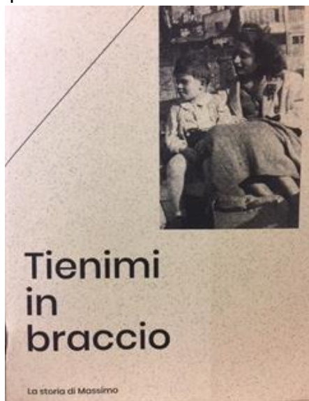
TIENIMI IN BRACCIO

La mostra è aperta alla cittadinanza. Per informazioni è possibile contattare la Pinacoteca e l'USR per il Piemonte, Ufficio per lo Studente, l'Integrazione e la Partecipazione.