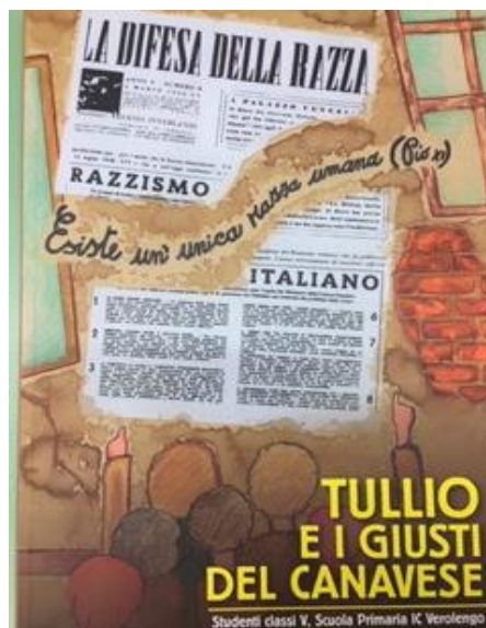
TULLIO ED I GIUSTI DEL CANAVESE

Realizzato dagli alunni della classe II A della Scuola Primaria "Domenico Luciano" di Givoletto - IC Druento (TO) per la XVII ed. del Concorso "I giovani ricordano la Shoah" - a.s. 2018-2019