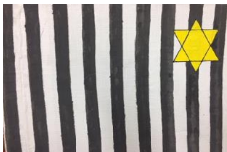
Classe III A - Istituto di Istruzione Secondaria di I grado Dante Alighieri, per il Concorso "I giovani ricordano la Shoah", a.s. 2018 - 2019

Realizzato dalle classi V della Scuola Primaria I.C. Verolengo - TO