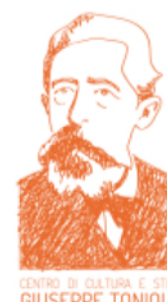
CENTRO DI CULTURA E STUDI GIUSEPPE TOMIOLO