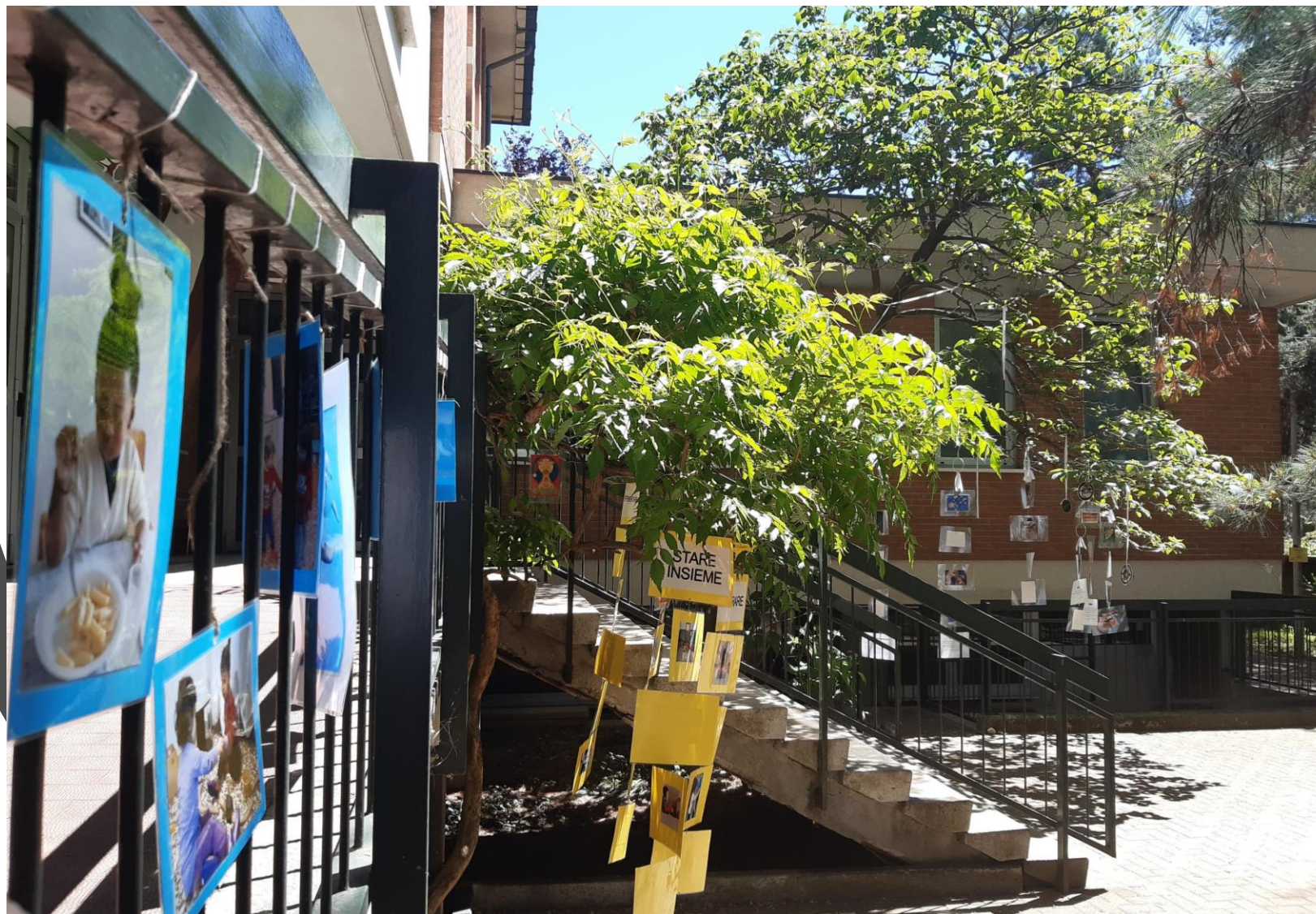
La documentazione fotografica all'ingresso del Polo06